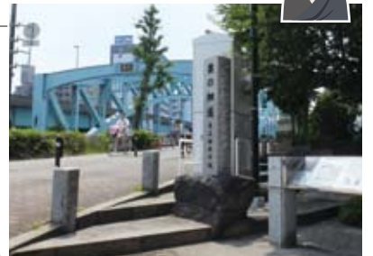
千住大橋 矢立初めの地